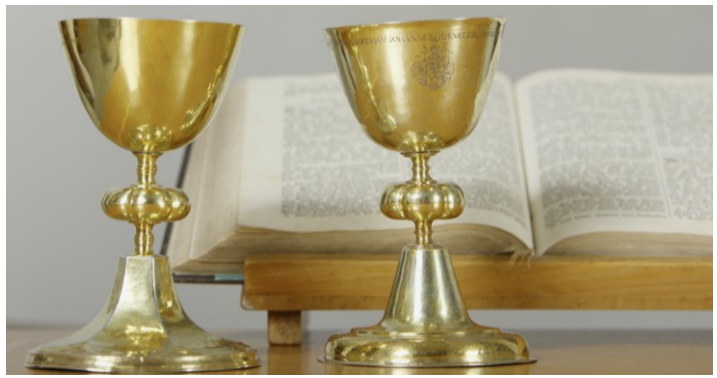
Abendmahlskelche von Hundwil, um 1505